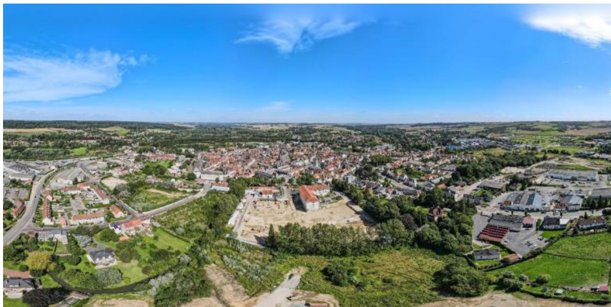
Vue panoramique de la ville d'Hesdin

Le bâti récent est composé essentiellement de constructions à usage d'habitation. C'est une forme d'habitat qui a investi les interstices existants au sein du tissu bâti ancien ou s'est développée en extension urbaine. Ainsi, dans les formes urbaines récentes on retrouve : les constructions période art déco et villa balnéaire, les constructions de Clovis Normand, les maisons mitoyennes ou maisons jumelées et le pavillon individuel.